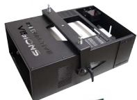
Mounting set Montageset

Beispiel: Sanyo XM100L 150L und ein Shuttle Computer zur Steuerung.