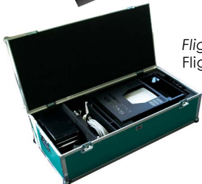
Flight Case Flight Case